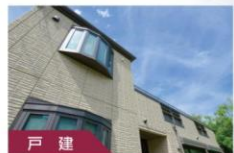
戸建 既存住宅かし保証保険 を使った仲介のご案内