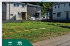
土地 現況調査(境界・測量) を使った仲介のご案内