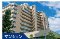
マンション 住宅設備検査保証 を使った仲介のご案内