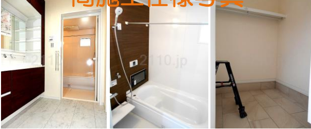
広く使える洗面脱衣所 16V型浴室テレビ付バス 土間クローゼット