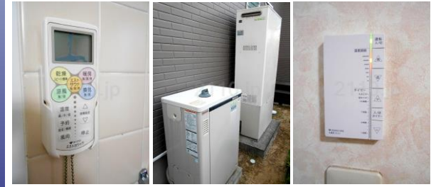
浴室乾燥暖房機 ミストサウナ機能付 省エネガス給湯器 エコウィル 洗面脱衣所にガス床暖房 (寒い冬にあると便利)

☆土地約72.51坪、建延約36.44坪☆東西二方道路の為、陽当・通風良好☆収納豊富☆サンデッキ☆カーポート並列3台★H20年8月改装済：■外壁屋根塗装■カーポート設置■給湯器交換：エコウィル■洗面脱衣所にガス床暖房設置等