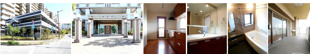
駐車場 エントランス 対面キッチン 洗面化粧台 浴室サイズ 1620 バルコニー

神鉄道場駅より ★三田駅へ電車3駅7分 ★三宮駅へ電車13駅34分 ★有馬温泉駅へ7駅17分 【不動産の概要】●所在地/神戸市北区鹿の子台北町2丁目●専有面積(壁芯)/94.8㎡(約28.67坪)●バルコニー/約40.8㎡●構造/鉄筋コンクリート造地上14階建/7階部分●間取り/4LDK+ウォークインクローゼット●土地の権利/所有権●敷地総面積/8568.55㎡(約2591坪)持ち分:1091364分の9480●築年月/2008年(平成20年)2月●用途地域/第一種中高層住居専用地域●月額管理費/9,960円●月額修繕積立金/6,640円●管理形態/全部委託(管理人日勤)●現況/空き家●引渡し/相談●検査済証/有●ポーチ5.98㎡。室外機置場0.80㎡。自転車置場月額2000円。バイク置場月額5000円～。