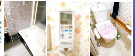
追焚機能付バス 浴室乾燥暖房機 温水洗浄トイレ