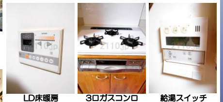
LD床暖房 3口ガスコンロ 給湯スイッチ

検査事業者が保証契約に基づき、保険の基準に従って検査し買主様に対して保険対象部分の隠れた瑕疵の瑕疵保証責任を負う場合、保証責任の履行による損害(費用)に対して保険金が支払われます。