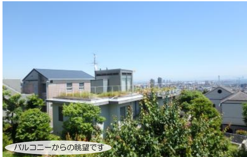
バルコニーからの眺望です