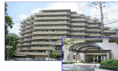
建物外観とエントランス

☆平成29年5月改装済 フローリング・ユニットバス・クロス トイレ・洗面化粧台・下駄箱 キッチン・畳・襖・ハウスクリーニング