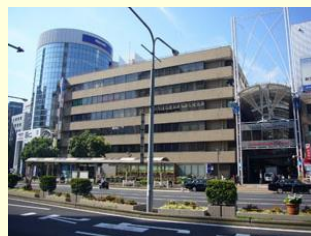
スタッフ一同ご来店・ご相談を お待ちしております。