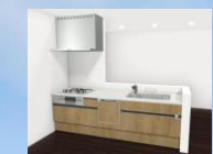
イメージ画像 システムキッチン エーエス