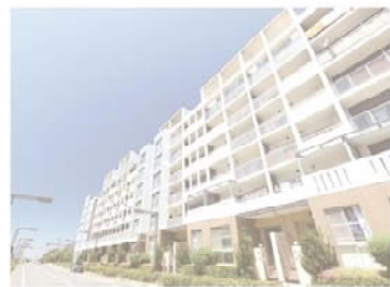
※画像等はサンプルです

1976年創業 不動産の売買・賃貸・リフォーム・管理についてのご相談は日住サービスにお問い合わせ下さい