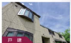
戸建 既存住宅かし保証保険 を使った仲介のご案内