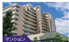
マンション 住宅設備検査保証 を使った仲介のご案内