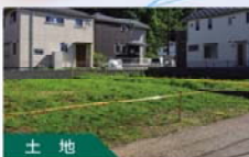
土地 現況調査(境界・測量) を使った仲介のご案内