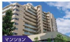
マンション 住宅設備検査保証 を使った仲介のご案内