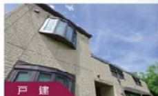
戸建 既存住宅かし保証保険 を使った仲介のご案内