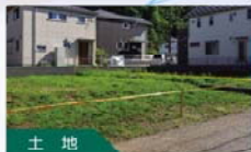
土地 現況調査(境界・測量) を使った仲介のご案内