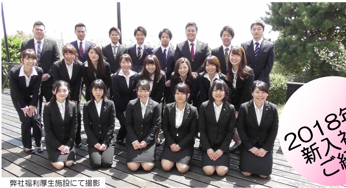
弊社福利厚生施設にて撮影