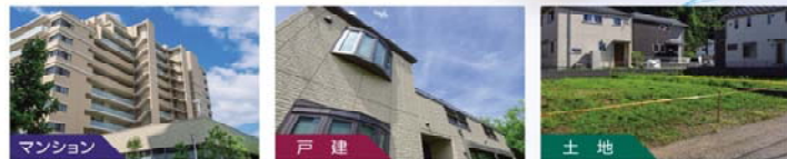
マンション 住宅設備検査保証 を使った仲介のご案内