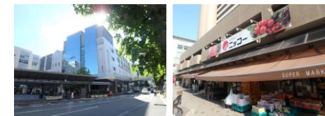
阪急「伊丹」駅…徒歩4分 買物施設「ニッコー」…約20m