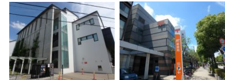
「伊丹図書館」…約140m 「伊丹郵便局」…約350m