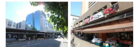
阪急「伊丹」駅…徒歩4分 買物施設「ニッコー」…約20m