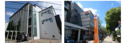
「伊丹図書館」…約140m 「伊丹郵便局」…約350m