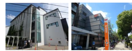
「伊丹図書館」…約140m 「伊丹郵便局」…約350m