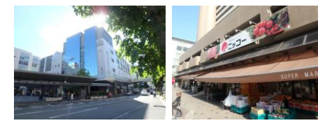
阪急「伊丹」駅…徒歩4分 買物施設「ニッコー」…約20m