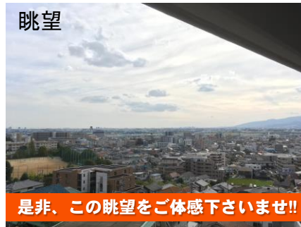
是非、この眺望をご体感下さいませ!!