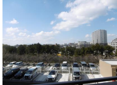
【西側バルコニーからの眺望】