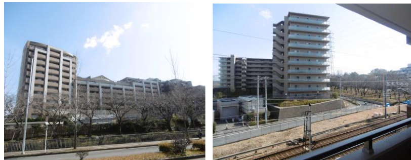
【東側バルコニーからの眺望】