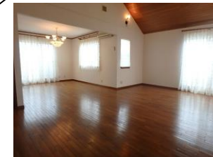
約20帖の明るい2階リビング