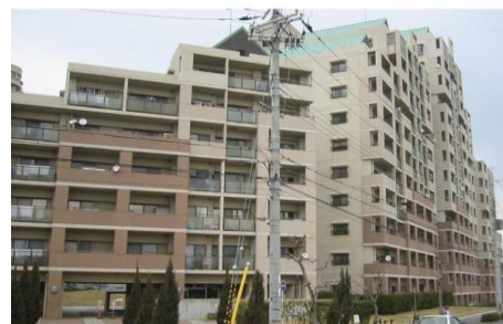
東南向きの明るいマンション

泉北「和泉中央」駅 徒歩4分 賃料 10 万円 / 分譲貸マンション 3LDK ユニライフ和泉中央B棟