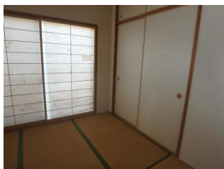
和室もございます。