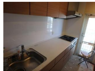
勝手口付のキッチン