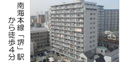
南海本線「堺」駅 から徒歩4分

▼平成30年3月リフォーム箇所 システムキッチン(食洗機付き) ユニットバス・洗面化粧台・便器・ 温水洗浄便座 交換 クロス張替え(壁・天井): 全室 カーペット張替え: LDK・洋室・ホール クッションフロア張替え: 洗面所・トイレ 間取り変更、建具交換 等々