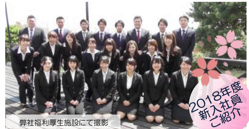
弊社福利厚生施設にて撮影