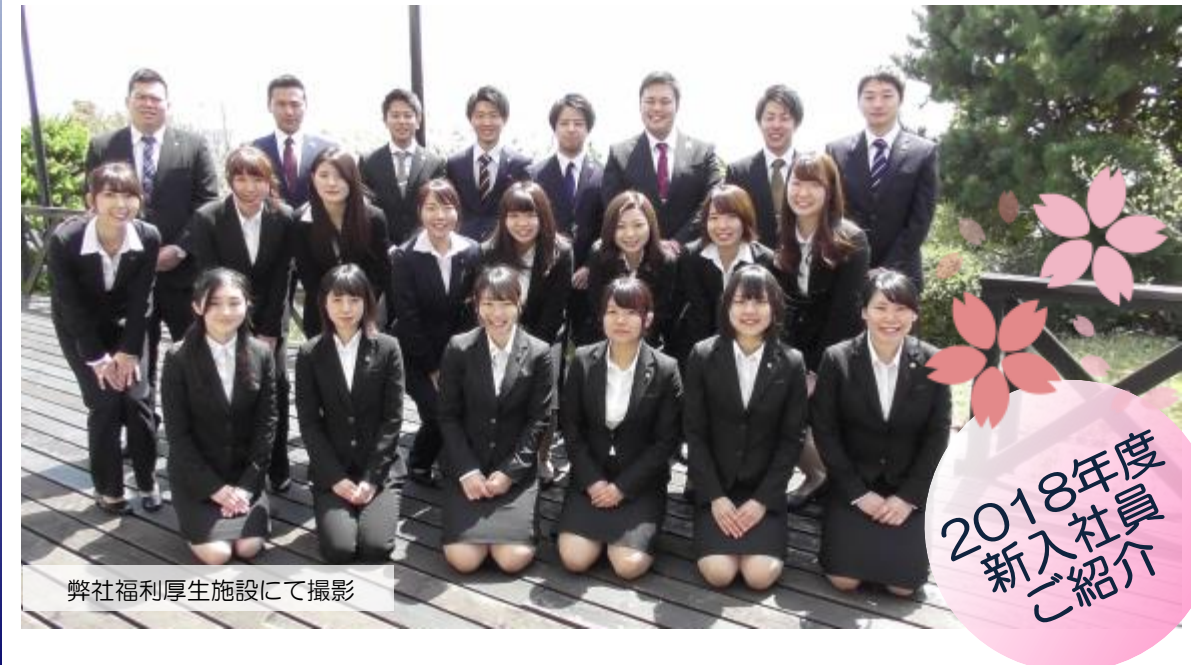
弊社福利厚生施設にて撮影