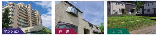
マンション 住宅設備検査保証を使った仲介のご案内 戸建 既存住宅かし保証保険を使った仲介のご案内 土地 現況調査(境界・測量)を使った仲介のご案内 詳細は担当までお尋ね下さい。