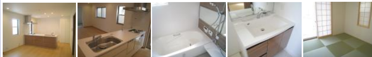
温水床暖房ヌック 食器洗乾燥機付き ミストサウナ機能付き 洗面台 和室(琉球畳)

【物件の概要】●新築分譲住宅(総戸数4戸・今回販売戸数2戸)●事業主・売主/株式会社日住サービス●所在地/京都市左京区松ヶ崎樋ノ上町8-6他●交通/叡山電鉄「修学院」駅徒歩7分、地下鉄烏丸線「松ヶ崎」駅徒歩14分●用途地域/第1種低層住居専用地域●建ぺい率/50%●容積率/80%●地目/宅地●地勢/平坦●私道負担なし●設備/関西電力、都市ガス、京都市上下水道 <1号地>●土地面積(約)/115.27㎡●建物面積/92.01㎡●構造/木造2階建●土地の権利/所有権●接道/北東側・幅員約6m私道(位置指定有)に間口約6.6m接面●建築確認/第BVJ-EOS17-10-1228号<2号地>●土地面積(約)/115.41㎡●建物面積/92.29㎡●構造/木造2階建●土地の権利/所有権●接道/北東側・幅員約6m私道(位置指定有)に間口約6.6m接面●建築確認/第BVJ-EOS17-10-1229号●建物完成/平成30年4月●引渡予定/相談